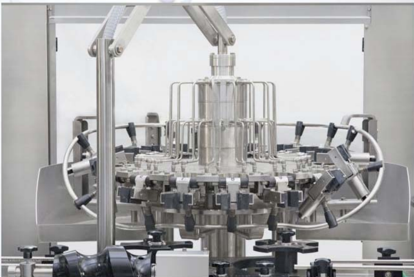
Torretta a doppio trattamento con tubi inox Double treatment turret with stainless steel pipe Tourelle à double traitement avec tuyaux inox Säule mit doppeltem Verfahren mit Edelstahlrohren Torreta de doble tratamiento con tubos inox