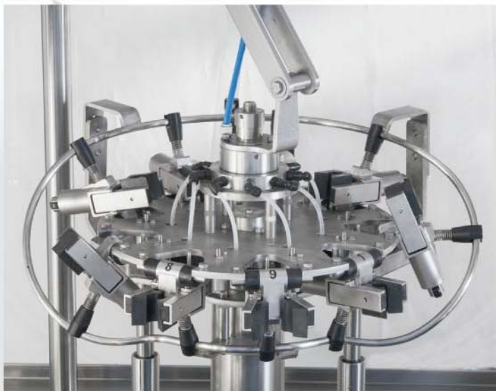
Torretta Tecna XP a 9 pinze 9-gripper Tecna XP Turret Tourelle Tecna XP à 9 pinces Tecna XP Säule mit 9 Zangen Torreta Tecna XP de 9 pinzas