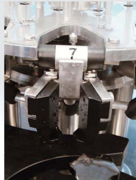
Particolare della pinza di presa bottiglia Detail of the bottle neck gripper Détail de la pince de prise bouteille Detail der Flaschengreifzange Detalle de la pinza de agarre botella

A modern bottling line cannot leave aside an efficient rinsing/sterilization system for the bottles. TECNA line is the response of Borelli group to this important need. TECNA line is a complete range of rinsing, sterilizing, blowing machines with high technological standards characterized by extreme flexibility and great facility of maintenance and use. They are available in versions from 1,000 up to 15,000 bph. TECNA line rinsing machines are available in free-standing versions or integrated in the monoblocks of the EURO System series.